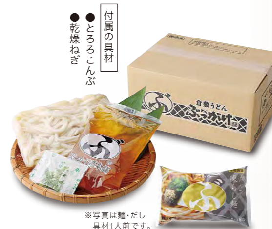
※写真は麺・だし具材1人前です。