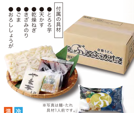
※写真は麺・たれ具材1人前です。