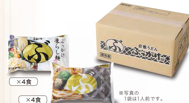
※写真の1袋は1人前です。

ふるいちはぶっかけだけではなく。 利尻昆布など厳選素材を使用したこだわりの「だし」は 飲み干すほどのおいしさでリピート率の高い商品です。 こちらの商品は「たれ派」も「だし派」もどちらにも満足していただけます。