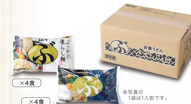
※写真の1袋は1人前です。

麺とぶっかけうどんのだし、具材をセットにした大好評の商品です。 とろろ細ぶっかけの細麺はとろろとたれが絡みやすかつつとしたのど越しが最高です。 温・冷どちらでもお楽しみいただけます。